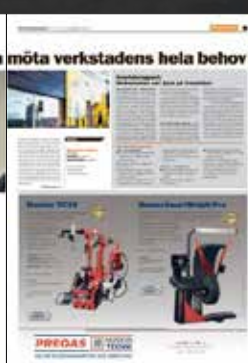
Elbilen i Sverige