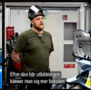
Efter den här utbildningen känner man sig mer bekväm.