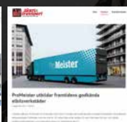
Akeri & transport