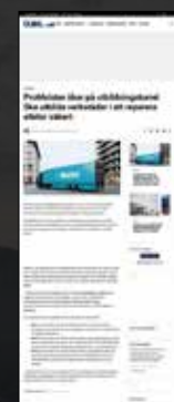
Allt om elbil